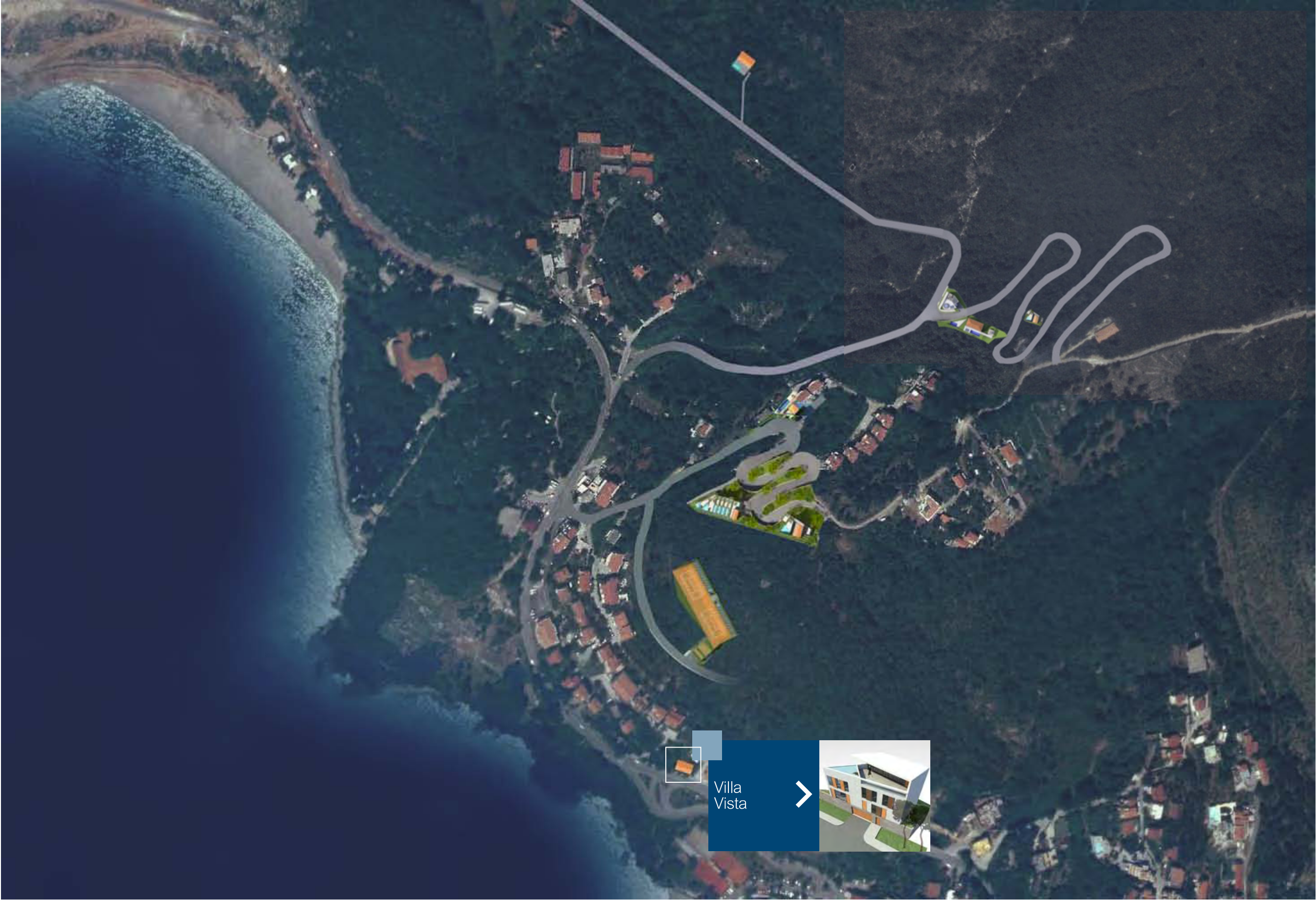
AVIO SNIMAK SA DISPOZICIJOM OBJEKATA